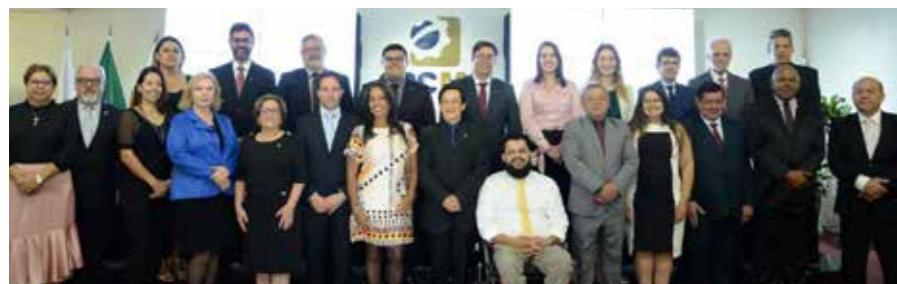
Conselheiros são empossados durante reunião plenária

CRCMG renovou 1/3 de seu Plenário e elegeu a nova diretoria para o biênio 2020/2021