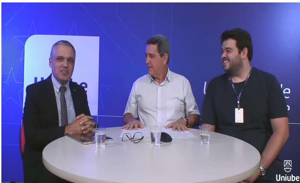
Bate-papo na rádio da Uniube - Cidadania Fiscal e IRPF: um ganha-ganha para o contribuinte e para a sociedade- NAF/UNIUBE