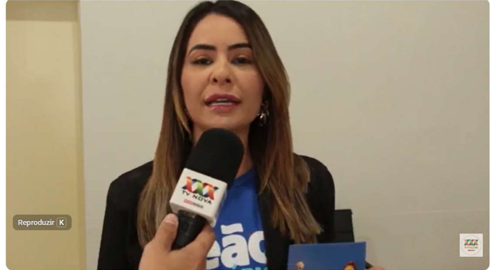
Parceria entre NAF e Município visa conscientizar sobre a importância da doação do imposto de renda