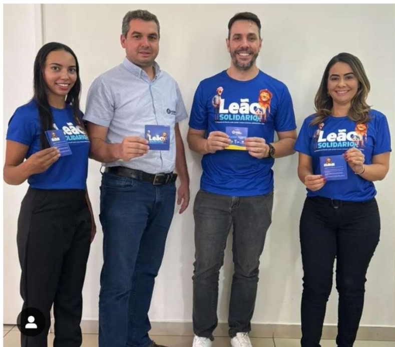
Visita aos escritórios de contabilidade do município (6) - NAF/UNIFUCAMP