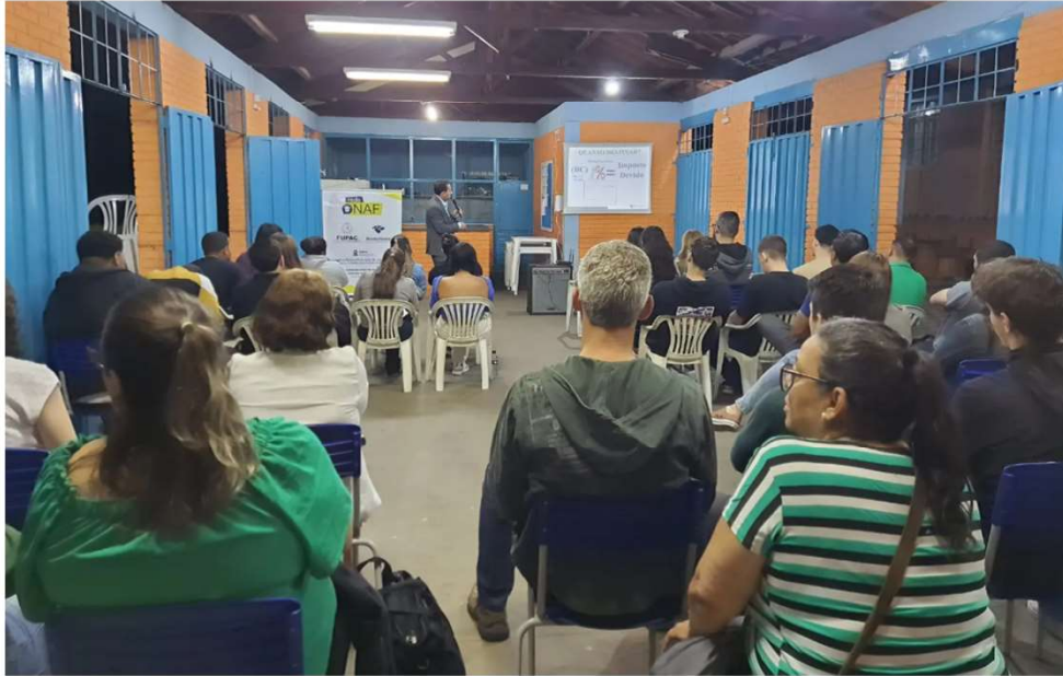
Palestra sobre destinação IRPF para instituições sociais - NAF/FUPAC/BAEPENDI