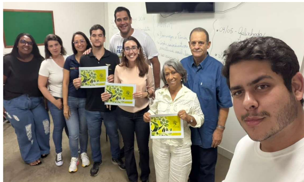
NAF recebe a OSC ADVEM Uberlândia para orientar sobre a destinação de IR em declarações completas e os procedimentos das OSC, incentivando doações em benefício de crianças.