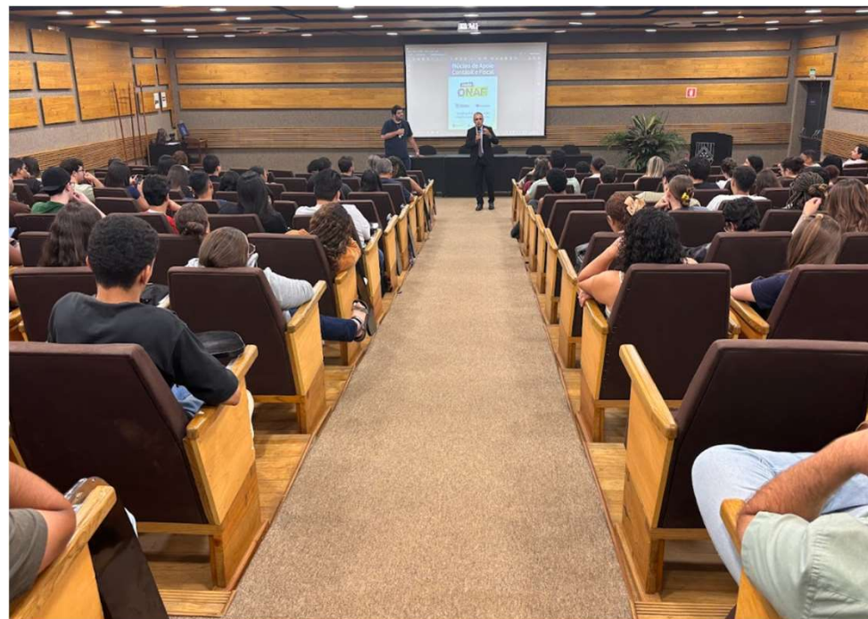
Divulgação da campanha destinação do imposto de renda durante o PAE (Programa de Atenção aos Estudantes) - NAF/UNIUBE