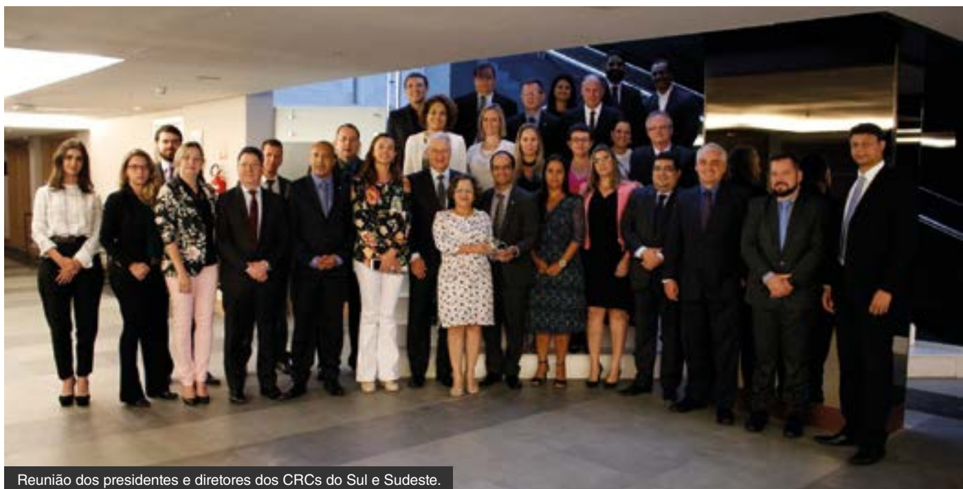
Reunião dos presidentes e diretores dos CRCs do Sul e Sudeste.