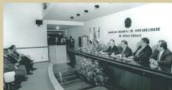
Evento realizado no auditório do CRCMG em 1999