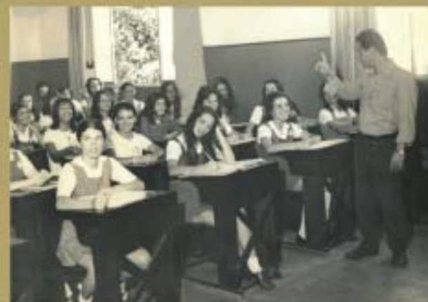
Representante do CRCMG fala sobre as atividades do Conselho para os alunos da Fundação Educacional Machado Sobrinho