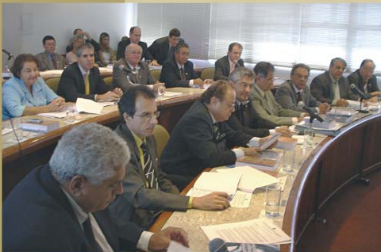
Conselheiros durante reunião plenária realizada em abril de 2007