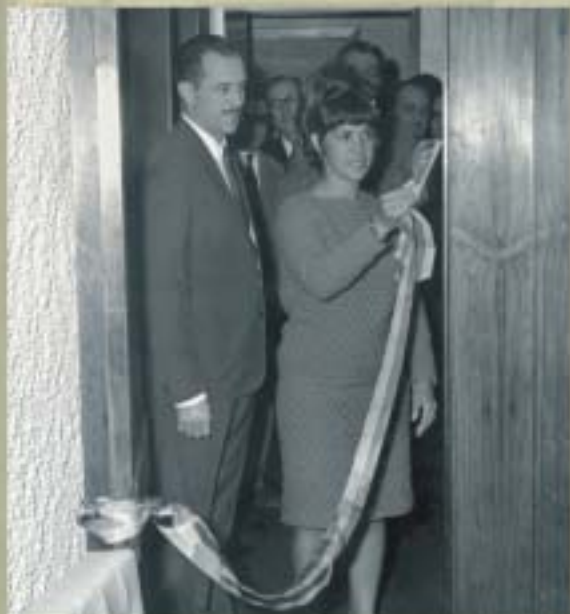
Em 1966, o CRCMG inaugurou a sua segunda sede, transferida para a rua Goitacazes no centro de Belo Horizonte