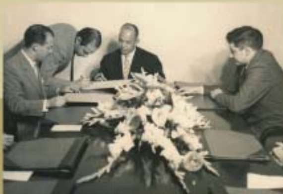
Assembléia eleitoral realizada em 1958.