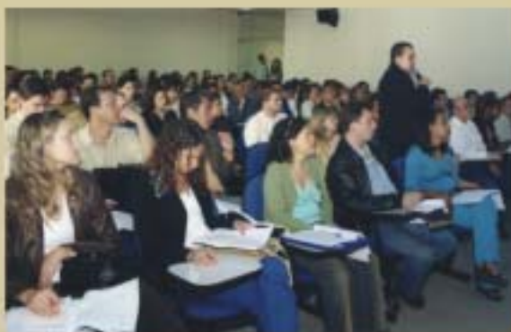
Curso de Classificação Contábil realizado no auditório do Conselho, em 2003