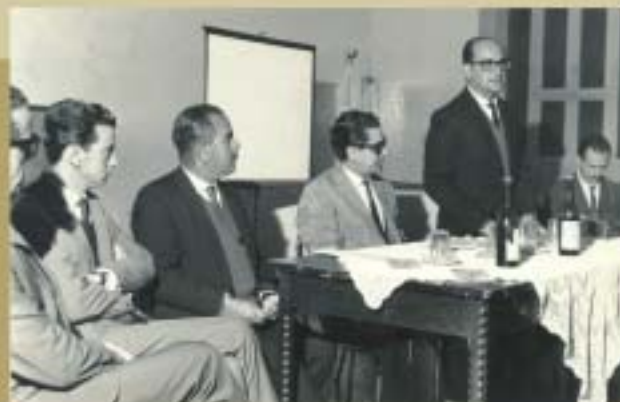
Instalação da delegacia seccional de Santos Dumont

Hoje o CRCMG segue o modelo de fiscalização proposto pelo CFC: a Fiscalização Preventiva. Aliada às premissas da Educação Profissional Continuada, essa forma de atuação tem resultado na diminuição do número de autuações e multas aplicadas. Os 14 fiscais do CRCMG que atuam em todo o Estado têm como objetivo orientar os contabilistas quanto aos padrões legais, técnicos e éticos da profissão. Esse trabalho é feito visando a prevenção e a orientação dos profissionais.