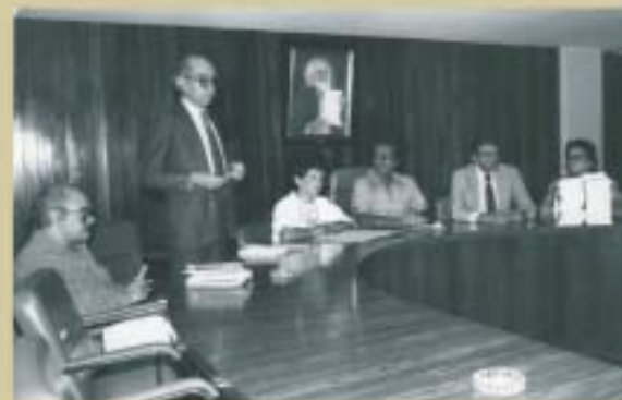
Solenidade de entrega de carteiras aos profissionais, realizada em dezembro de 1983