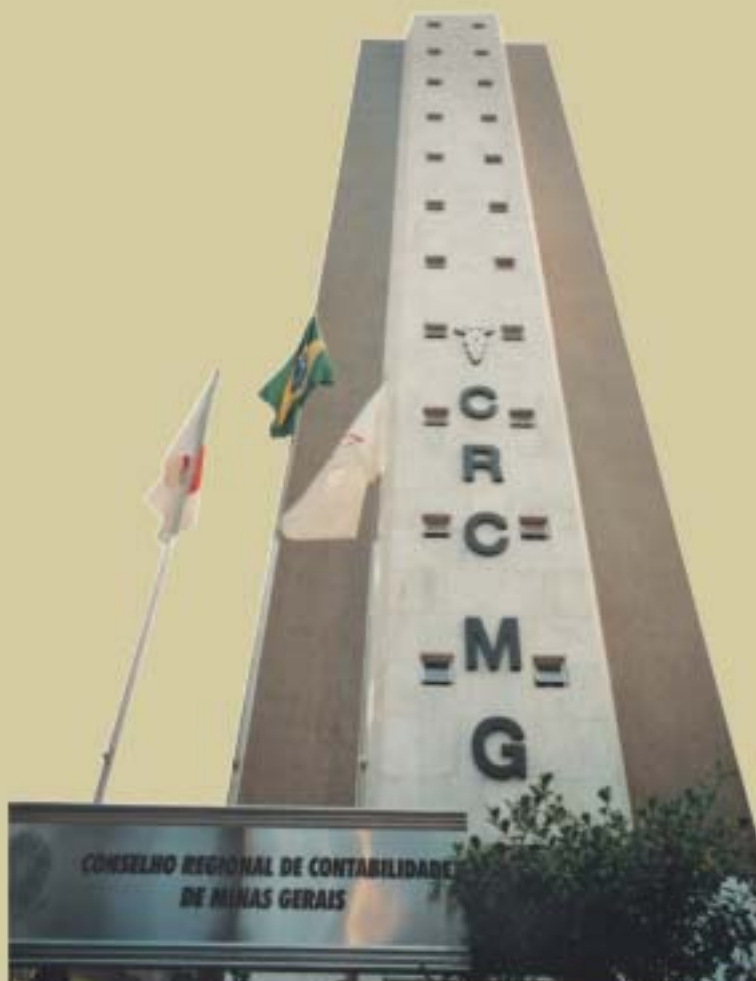
Sede atual do CRCMG inaugurada em agosto de 1997

Trata-se de uma sede ampla e moderna que congrega em um só espaço todas as gerências, biblioteca especializada, salas para treinamentos e cursos, auditório com capacidade para 130 pessoas e galeria de ex-presidentes. Tudo isso confere mais agilidade, eficiência e qualidade ao atendimento das necessidades do contabilista mineiro.