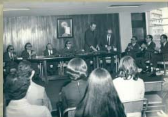
Em 25 de abril de 1972, o CRCMG inaugurou suas instalações na avenida Afonso Pena, centro de Belo Horizonte