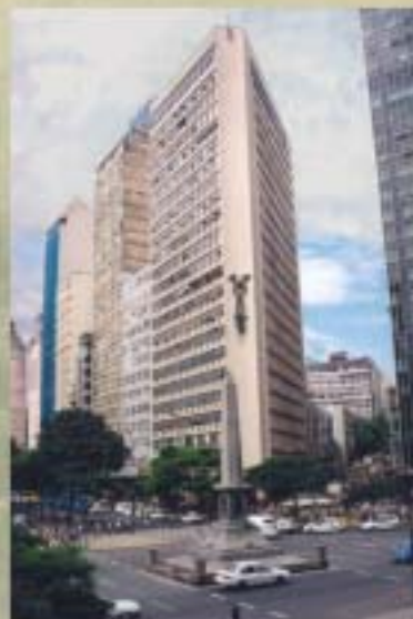
Edifício onde o Conselho manteve sua sede de 1972 a 1997

Ao fundo, a primeira sede do CRCMG ficava em duas salas situadas em edifício na rua dos Carijós no centro de Belo Horizonte