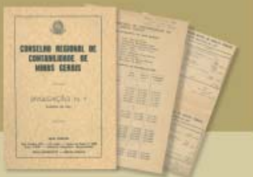
Primeira publicação do Conselho, em 1951