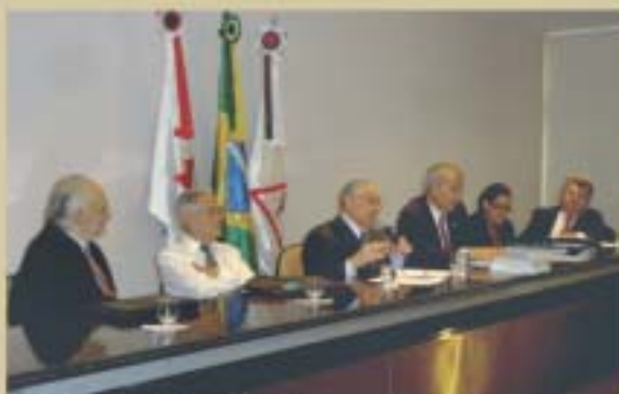
Audiência Pública realizada em janeiro de 2007, que analisou e debateu a versão 01 do anteprojeto de reformulação do Decreto-Lei 9.295/46.