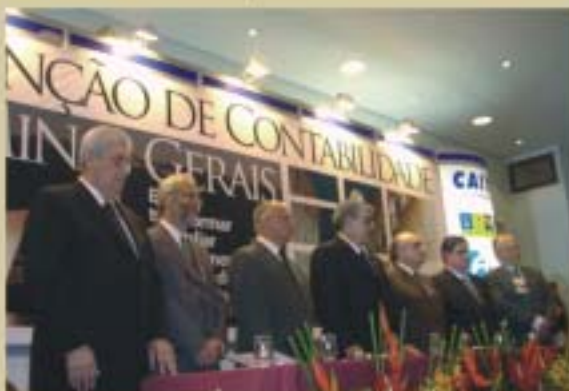
V Convenção de Contabilidade de Minas Gerais realizada em novembro de 2005. O evento reuniu 1.100 profissionais