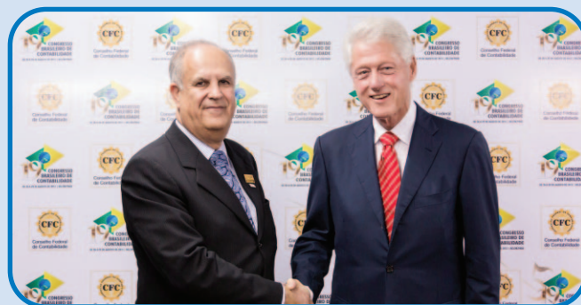
Marco Aurélio Cunha de Almeida (Presidente em Exercício do CRCMG) e Bill Clinton (42º Presidente dos Estados Unidos).

No dia 26 de agosto, houve o lançamento oficial das candidaturas dos estados que pretendiam sediar o 20º CBC. Durante três dias, o CRCCE e o CRCSC fizeram intensas campanhas para divulgar as belezas naturais e os potenciais dos seus estados e convencer os congressistas a votarem em suas cidades. Os congressistas escolheram o estado sede do próximo Congresso Brasileiro de Contabilidade, anunciado na cerimônia de encerramento: o Ceará.