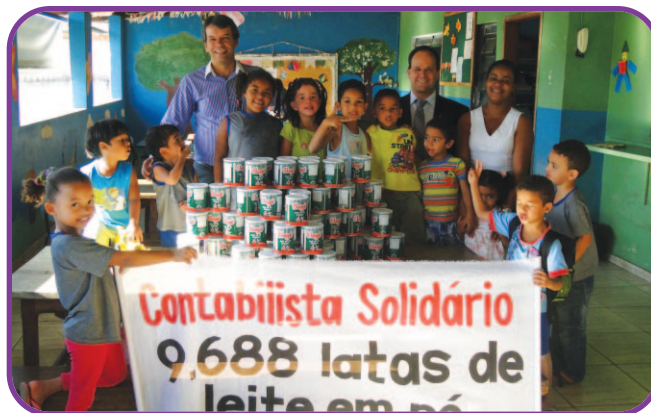
Creche Lírio do Vale em Contagem/MG

Conheça e ajude as entidades cadastradas! Os interessados podem fazer contato pelo telefone (31) 3269-8460 e obter os dados necessários.