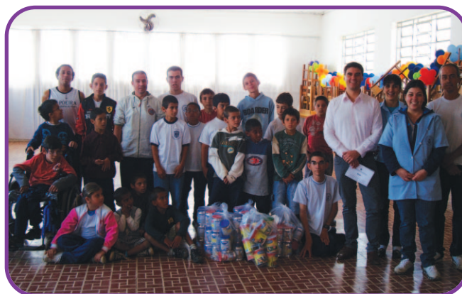
Lar Esperança e Amor de Passa Quatro/MG