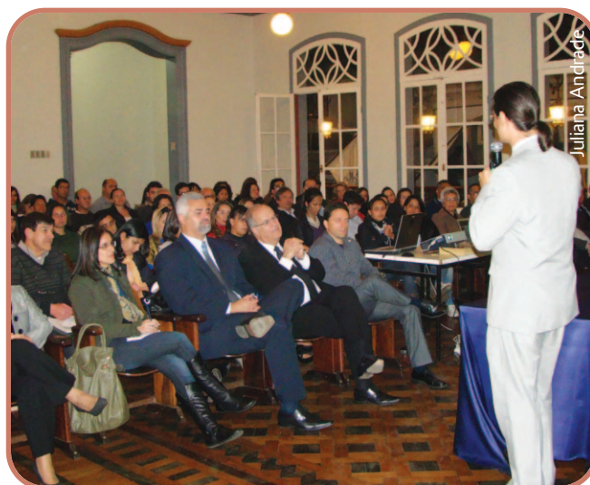
Seminário realizado em Ouro Preto contou com 70 participantes.

*O evento ocorrerá em São Lourenço, com o apoio das delegacias de Caxambu, Três Pontas e Passa Quatro.