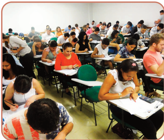
Em Belo Horizonte, 1.909 candidatos fizeram as provas na Faculdade Pitágoras

O número de candidatos inscritos no estado aumentou em relação ao último exame. Para essa edição, inscreveram-se 5.058 candidatos, sendo que 4.085 inscreveram-se para fazer a prova de Bacharel em Ciências Contábeis e 973, para Técnico em Contabilidade. Os candidatos que estão cursando o último ano do curso de Ciências Contábeis, além daqueles que já concluíram efetivamente a graduação, puderam realizar a prova do Exame de Suficiência. Já para a prova de Técnico em Contabilidade, continuou sendo necessária a conclusão do curso.