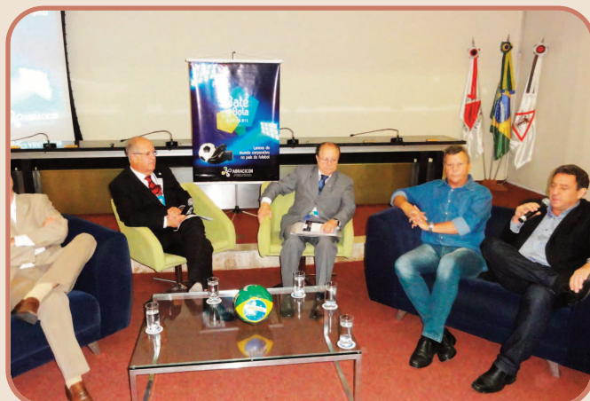
Talk-show abordou questões relativas à Copa do Mundo 2014.