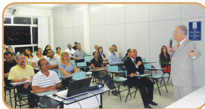
CRCMG Itinerante em Betim

Com o intuito de oferecer capacitação de qualidade e aperfeiçoamento aos profissionais contábeis, o CRCMG realizou, em 2013, 69 cursos presenciais sobre temas de interesse da classe. Desse total, 24 turmas foram formadas em Belo Horizonte e 45 no interior do estado. Os cursos aconteceram de abril a dezembro e contaram com a participação de 2.133 profissionais nas cidades de Belo Horizonte, Contagem, Betim, Ouro Preto, Araxá, Montes Claros, Januária, Teófilo Otoni, Caxambu, Divinópolis, Unai, Barbacena, Guaxupé, Ipatinga, Alfenas, Passos, Curvelo, Formiga,