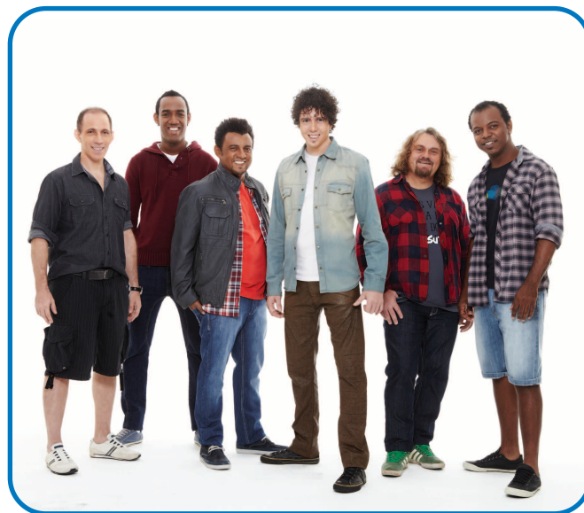
Semana da Contabilidade contará com a presença da Banda Sambô.