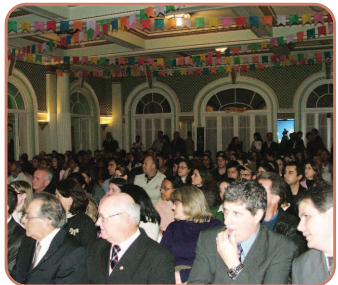
Cerca de 200 pessoas participaram do CRCMG Itinerante que ocorreu em Poços de Caldas.