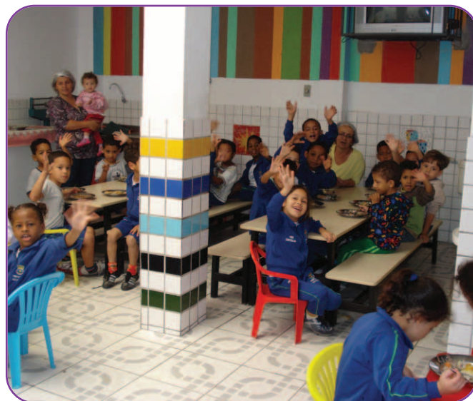
Creche Comunitária Tia Mamália

Faça parte do projeto Contabilista Solidário! Conheça e ajude as entidades cadastradas! Os interessados podem fazer contato pelo telefone (31) 3269-8422/8421 e obter os dados necessários.