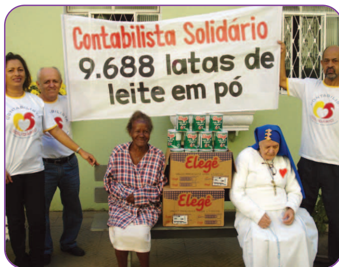
Lar dos Idosos Santa Rita de Cássia – SSVP (Conselho Particular de Santa Rita de Cássia SSVP).