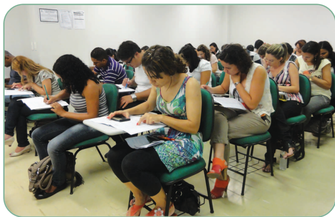
Em Belo Horizonte, os candidatos fizeram as provas na Faculdade Pitágoras.

O número de candidatos inscritos no estado aumentou em relação ao último exame. Para a 3ª edição, inscreveram-se 2.860 candidatos, 2.408 para fazer a prova de Bacharel em Ciências Contábeis e 452, para Técnico em Contabilidade. Este ano, o Exame contou com uma novidade: puderam fazer a prova para Bacharel em Ciências Contábeis os candidatos cursando o último ano do curso, além daqueles que já concluíram efetivamente a graduação. Já para a prova de Técnico em Contabilidade, continuou sendo necessária a conclusão do curso.