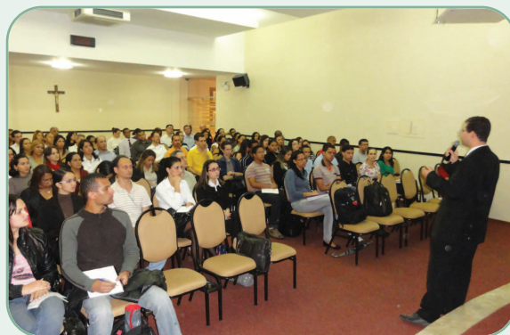
Mais de 400 pessoas já participaram do Papo sobre IFRS

Os interessados em participar devem ficar atentos aos informativos do Conselho.