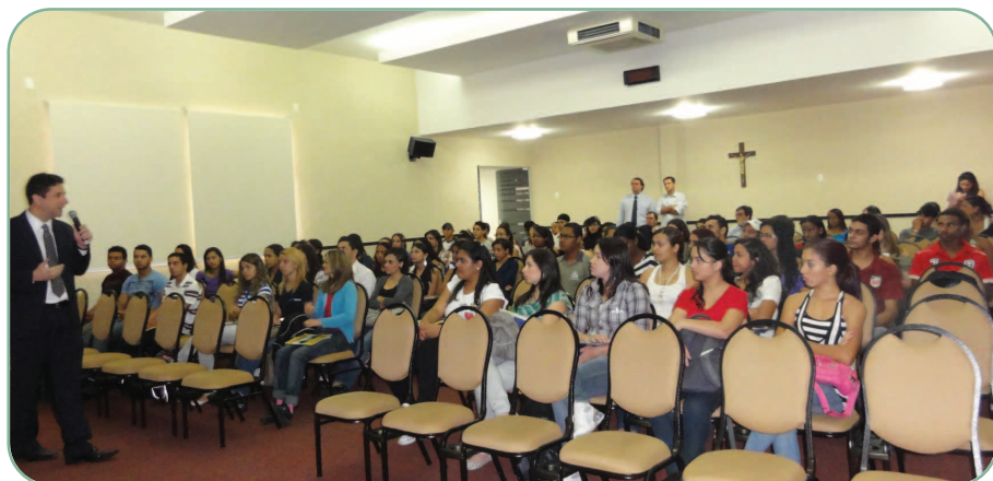
Estudantes receberam explicações sobre o funcionamento do Conselho e suas atribuições.

As visitas técnicas de alunos à sede do CRCMG podem ser agendadas pelos professores ou coordenadores dos cursos de Ciências Contábeis pelo e-mail: eventos@crcmg.org.br .