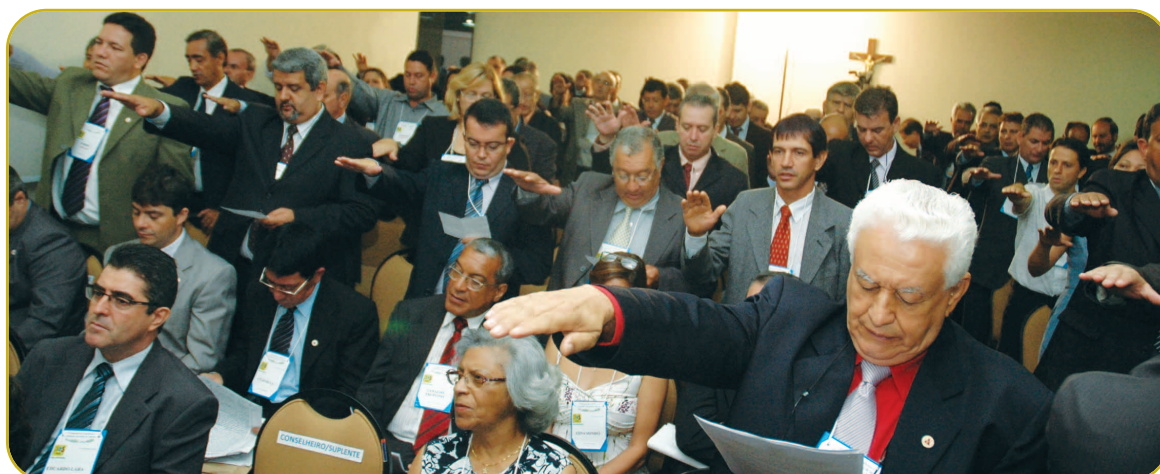
Delegados realizam juramento de posse