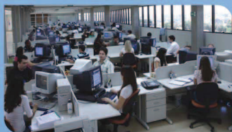
Fábrica de Softwares