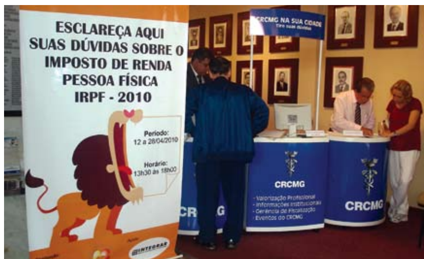
Contabilistas voluntários atenderam quase 200 pessoas