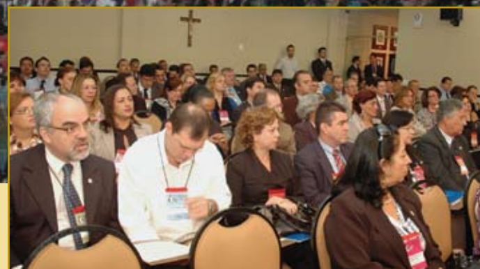
Profissionais participaram do Seminário de Integração dos Grupos de Trabalho

Durante a programação, os contabilistas participaram do programa Contabilista Solidário, por meio da doação de leite em pó em troca de ingressos para o show da Banda Cheiro de Amor e para a apresentação da peça "Comi uma galinha e tô pagando o pato".