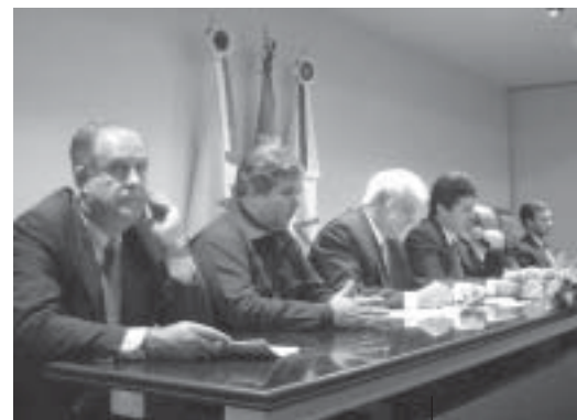
Diretores da Creditável apresentam as contas da Cooperativa durante Assembleia Geral

Relacionamento com os cooperados – Por reconhecer cada cooperado como dono da instituição é que a Creditável zela pela proximidade e o bom atendimento aos associados. Para isso, além do trabalho diferenciado de sua equipe, a Cooperativa investe em alguns instrumentos de comunicação como o jornal institucional, publicado trimestralmente, e a recém-lançada home page . Por meio deles, os cooperados se informam quanto às novidades da instituição e colaboram com sugestões. O endereço eletrônico é: www.creditabil.com.br .