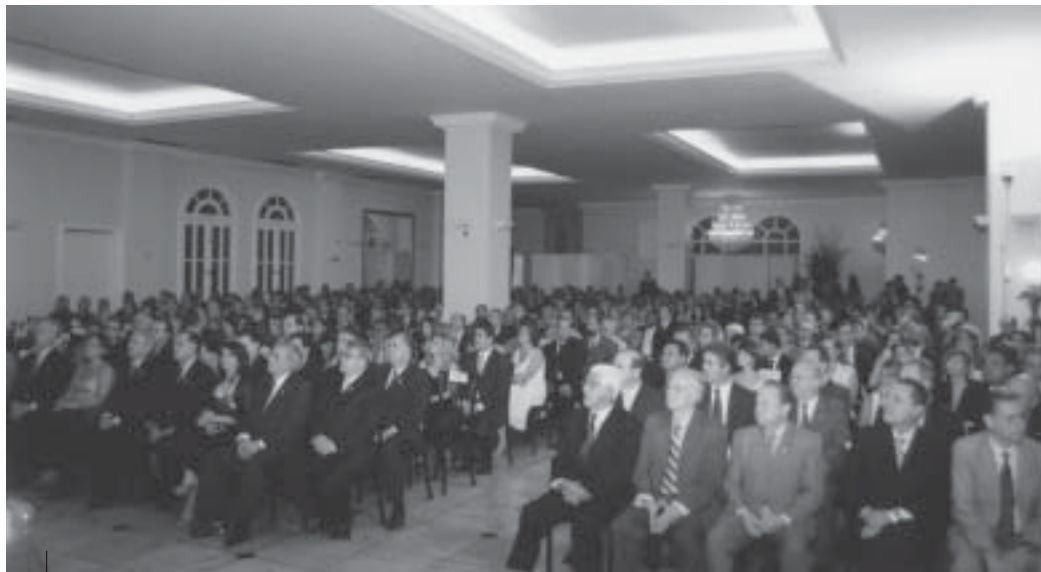
Mais de mil pessoas, entre contabilistas, empresários, convidados e autoridades do mundo político e econômico prestigiaram o evento realizado nos salões do Buffet Catharina, em Belo Horizonte

Confira na galeria de fotos alguns momentos da solenidade.